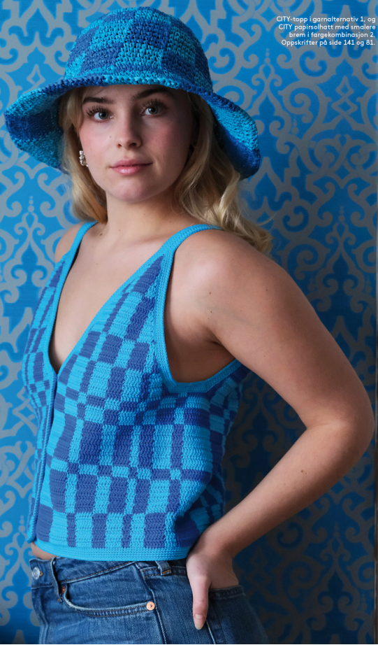
CITY-topp i garnalternativ 1, og CITY papirmodellert med smalere brem i fargekombinasjon 2. Oppskrifter på side 141 og 81.