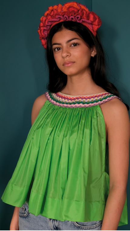
Volanghårbøyle, fargekombinasjon 1. Krage med vifter på silketopp. Oppskrift på side 217 og 263.