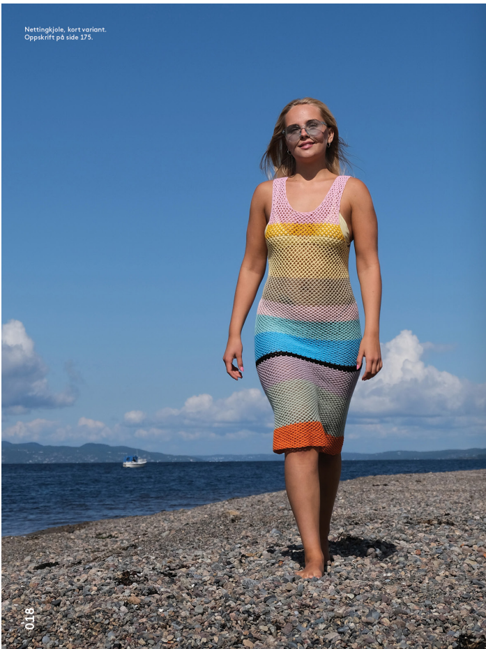
Nettingkjole, kort variant. Oppskrift på side 175.