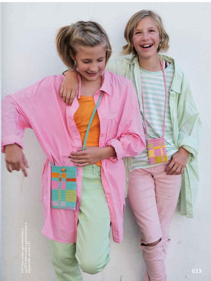
CITY liten veske, garnalternativ 2. og side 117 og side 117. Oppskrift på side 117.