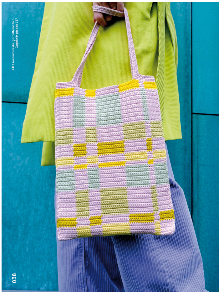
CITY medium veske, garnalternativ 1. Oppskrift på side 117.