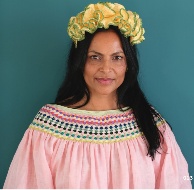
Volanghårbøyle, fargekombinasjon 2. Bærestykke med sifter på linbluse. Oppskrift på side 217 og 263.