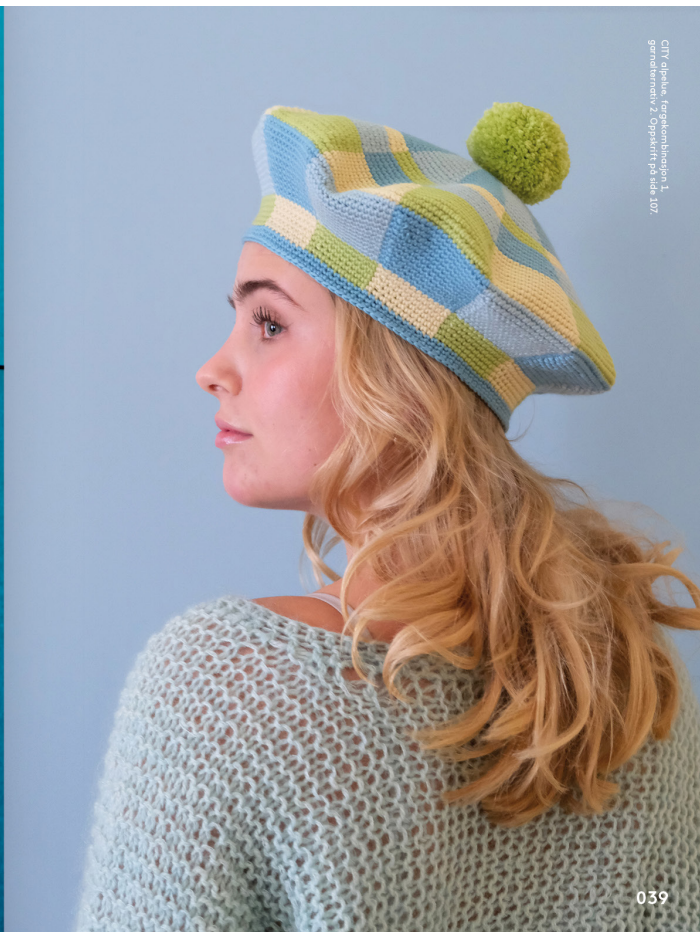
CITY øplue, fargesamband 1. garnalternativ 2. Oppskrift på side 107.