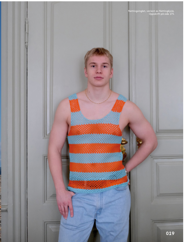
Nettingsjlet, variant av Nettingkjole. Oppskrift på side 175.